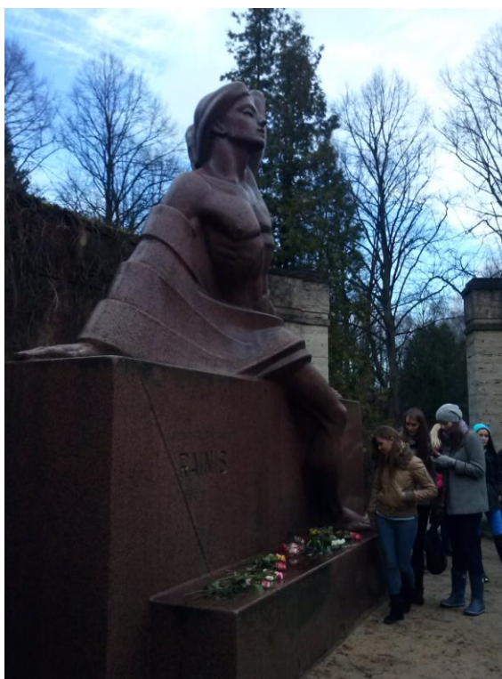
1.15.1.1.attēls. Grupas d05a un d05b studenti apmeklē Raiņa kapos.

Studiju kursa „Pasaules mākslas vēsture” ietvaros tika organizēta mācību ekskursija, kuras tēma bija „Memoriālā māksla Latvijā”. 2013.gada novembrī 1. kuras pilna laika studenti apmeklēja Raiņa un Brāļu kapus.